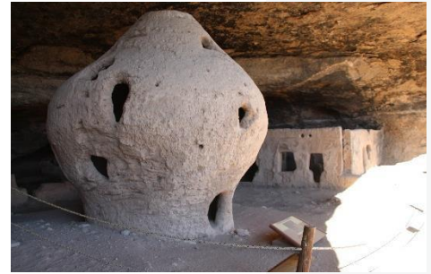
Cueva de la Olla, Creel