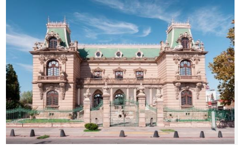
Quinta Gameros, Chihuahua