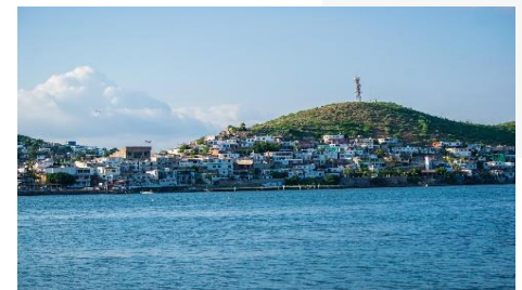
Bahía de Topolobampo, Mochis