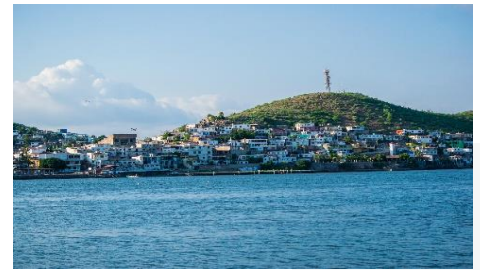
Bahía de Topolobampo, Mochis