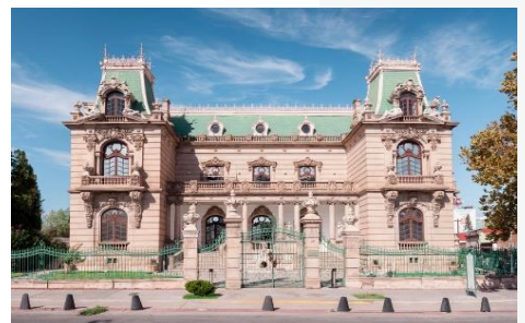
Quinta Gameros, Chihuahua