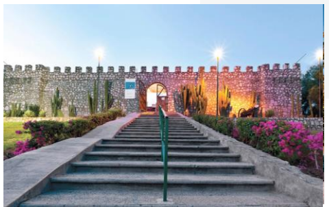
Museo El Fuerte Mirador, El Fuerte