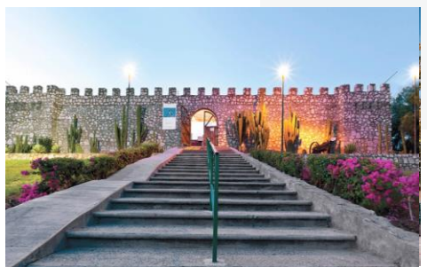
Museo Forte Mirador, El Fuerte