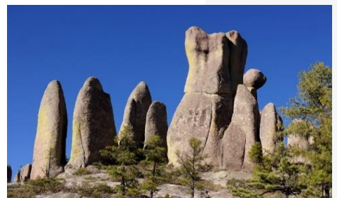
Valle de los Monjes, Creel