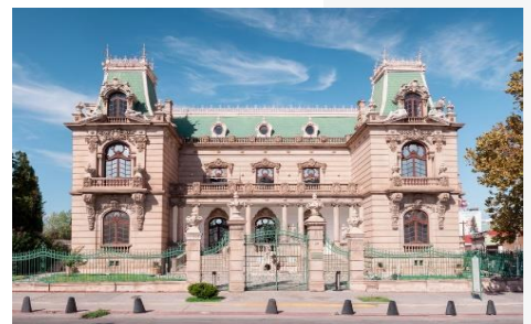
Quinta Gameros, Chihuahua